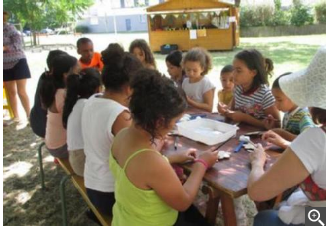
Le square Paradis.

Un beau succès car chaque jour entre 15 et 20 familles ont fréquenté ce lieu de convivialité. De quoi réaliser une saison estivale dans la joie et la bonne humeur !