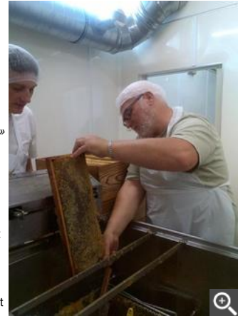
A Auchan Tours-Nord, on a procédé à la première récolte de miel.

Ainsi, les récoltes cette année ont été exceptionnelles dans les deux cas : 60 kg de miel (deux ruches) à L'Heure tranquille et 91 kg à Auchan (trois ruches). Le miel recueilli sera ensuite vendu dans un but caritatif. Le bénéfice social est donc bien présent.